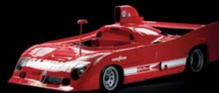
1975 – Tipo 33 TT12 Dominuje na Mondiale Marche