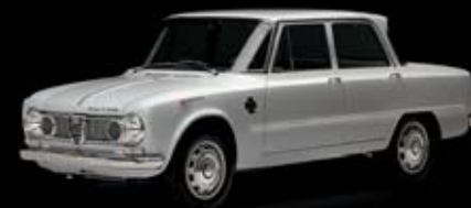
1963 – Giulia TI Super Giulia pojawia się na torze