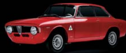
1965 – Giulia Sprint GTA Bezkonkurencyjna w kategorii Turismo