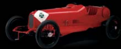
1923 – RL Targa Florio Dystansuje konkurencję – powstaje symbol czterolistnej koniczyny Quadrifoglio