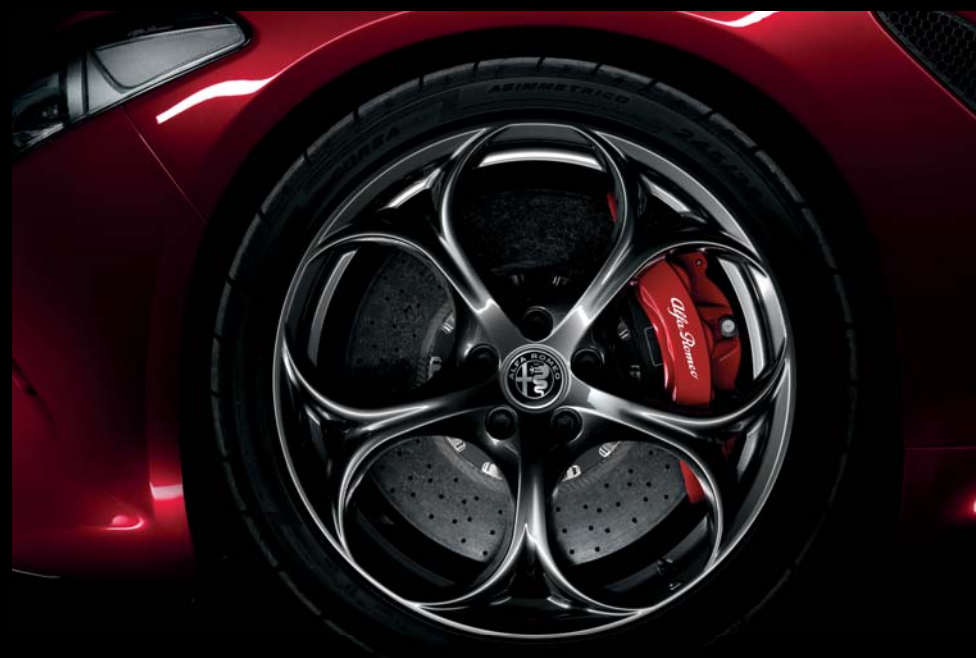
Felgi 19" chrom ciemny