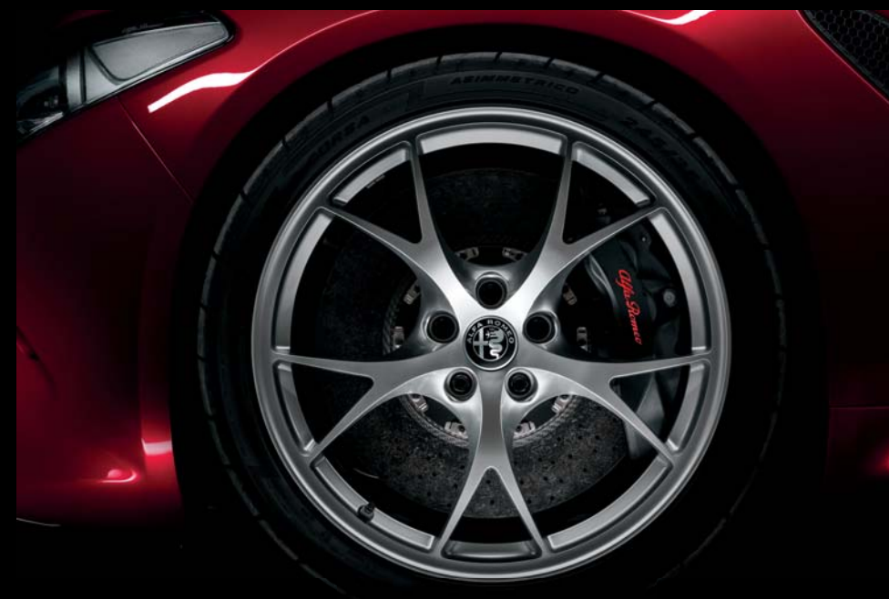
Felgi 19" ultralekkie