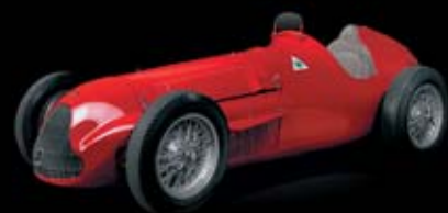
1951 – GP Tipo 159 "Alfetta" Wygrywa dwa pierwsze Mistrzostwa Świata Formuły 1