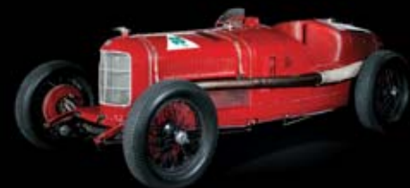
1925 – Gran Premio Tipo P2 Pierwszy mistrz świata w historii