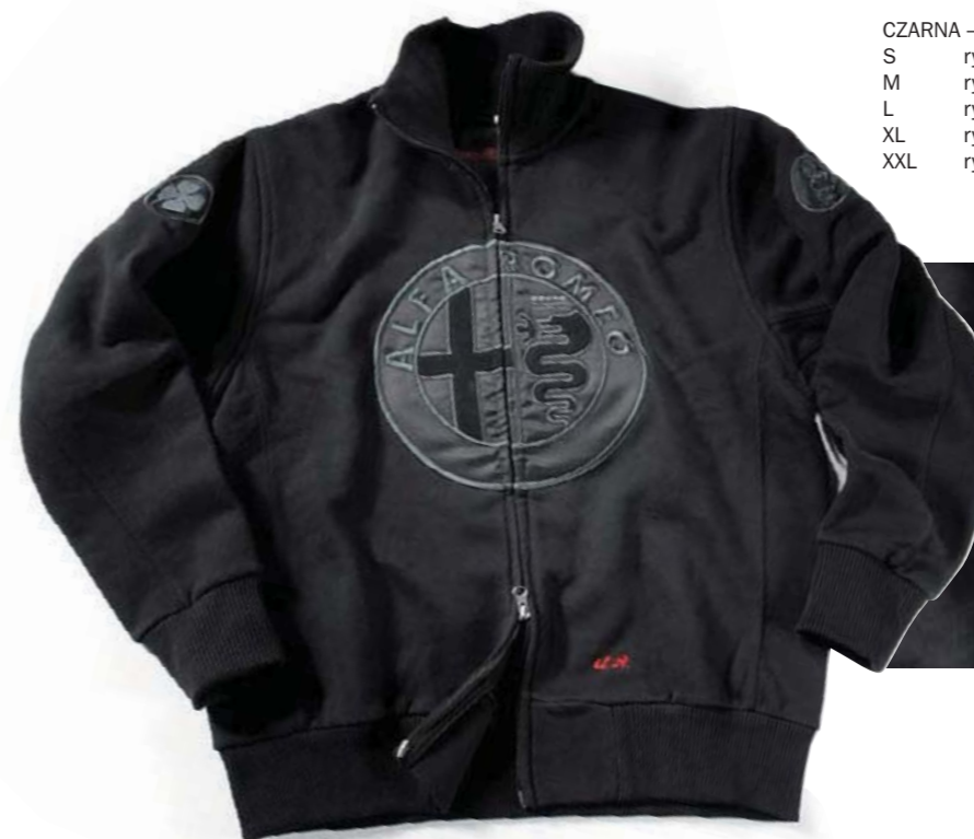
Bluza unisex zapinana na zamek. 100% bawełna, z logo Alfa Romeo w kolorze bluzy. Full-zip unisex sweatshirt. 100% cotton with Alfa Romeo brand embroidered in the same colour.