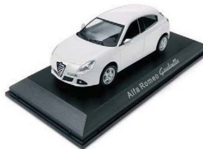
Modelik Giulietta. Skala 1:43. Collectable model Giulietta. Scale of 1:43.