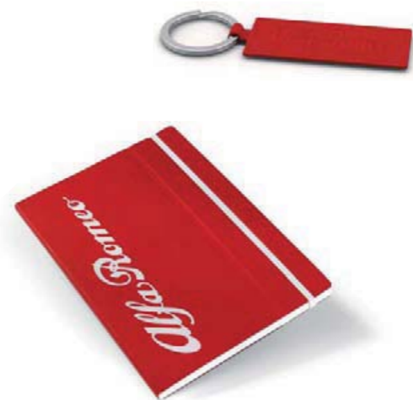
Notes Alfa Romeo. Wymiary 9 x 14 cm. Alfa Romeo Stifflexible notebook. Dimensions: 9 x 14 cm.