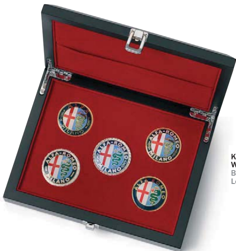
Kolekcja historycznych logotypów Alfa Romeo. Wymiary logo: 5,5 cm. Box set of historical Alfa Romeo logos. Logo diameter size: 5.5 cm.