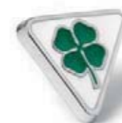
Pin z Quadrifoglio Verde. Quadrifoglio Verde pin.