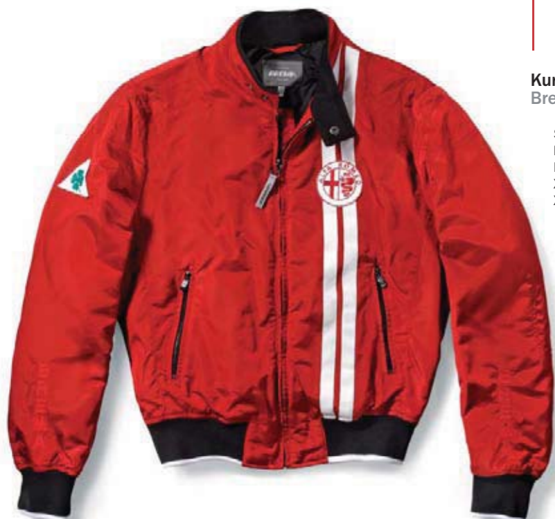
Kurtka Brema. Model unisex wykonany z tkaniny technicznej. Brema jacket. Hi-tech fabric unisex design.