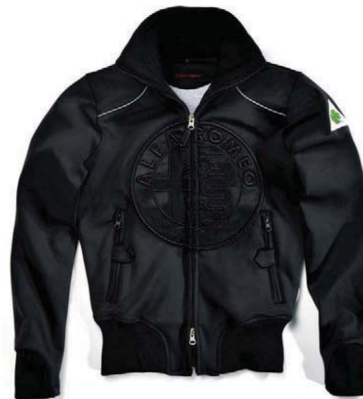
Bluza Urban Style. 100% bawełna, z logo Alfa Romeo w kolorze bluzy. Urban Style sweatshirt. 100% cotton, with raised Alfa Romeo brand in the same colour.