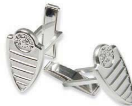
Spinki do koszuli srebrne. Design z tarczą grilla Alfa Romeo. Silver cufflinks. Grille design from Alfa Romeo sports cars.