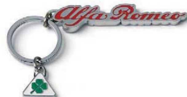
Breloczek na klucze metalowy ze znaczkem Quadrifoglio Verde. Quadrifoglio Verde metal key ring.