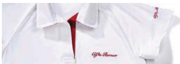
Koszulka polo z krótkim rękawem, biała. Z mikrofibry, zawiera logo Alfa Romeo w kolorze czerwonym oraz czerwoną wstawkę przy zapięciu. White short-sleeved polo shirt. Made of microfibre with embroidered red Alfa Romeo logo and matching buttons.