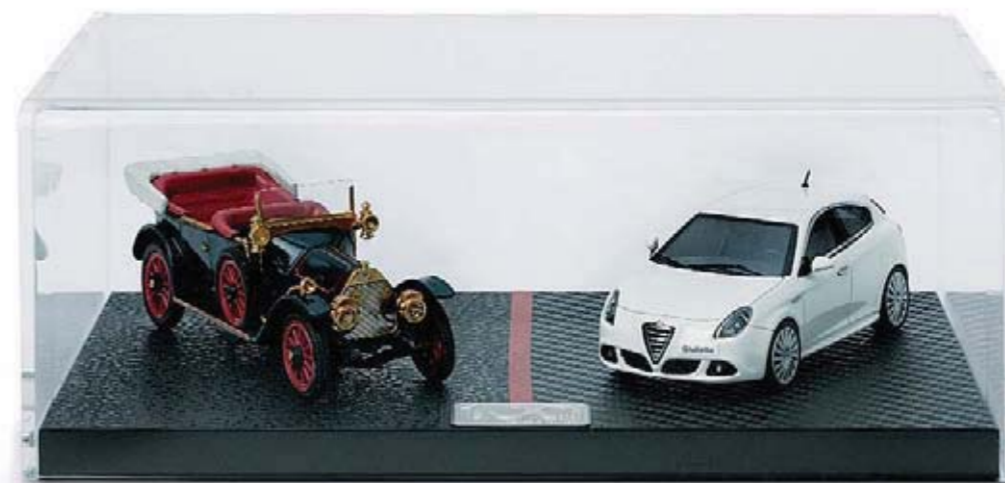
Zestaw modelików Giulietta & 24HP na stulecie Alfa Romeo. Seria limitowana i numerowana. Skala 1:43.

Centenario Giulietta & 24HP Box Set. Limited edition numbered box set containing a model Giulietta and a model 24HP reproduced with the utmost precision. Scale of 1:43.