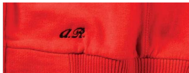
Bluza czerwona zapinana na zamek, zawiera logo Alfa Romeo w kolorze bluzy. Full-zip sweatshirt with Alfa Romeo brand embroidered in the same colour.