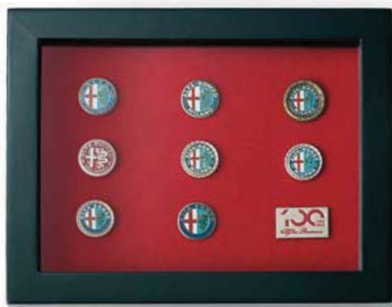
Zestaw 9 pinów z logo Alfa Romeo. Specjalna edycja na 100-lecie Alfa Romeo. Box set of historical Alfa Romeo logo pins. Special Centenario edition.