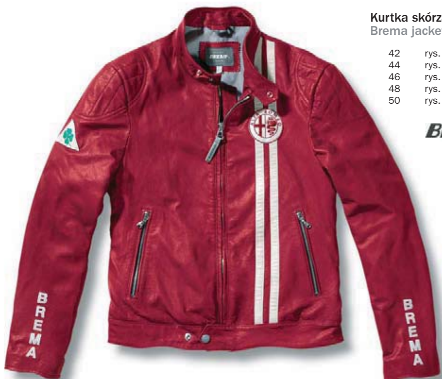
Kurtka skórzana Brema. Unisex, wykonana ze skóry typu nappa. Brema jacket. Nappa leather unisex design.