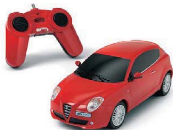
Modelik MiTo. Zdalne sterowanie, skala 1:24. Radio-controlled model MiTo. Scale of 1:24.