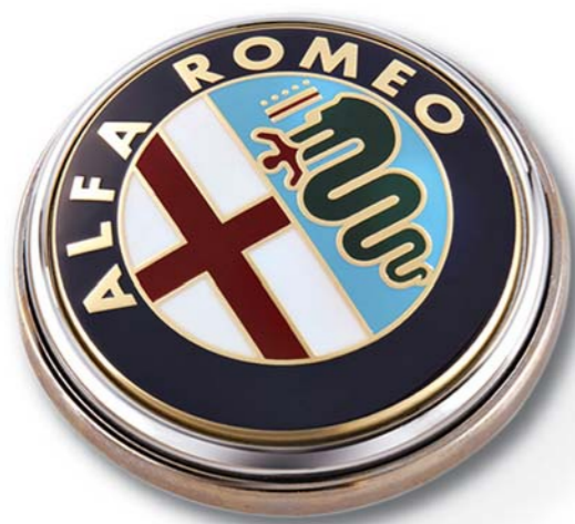
Przycisk do papieru. Paperweight.