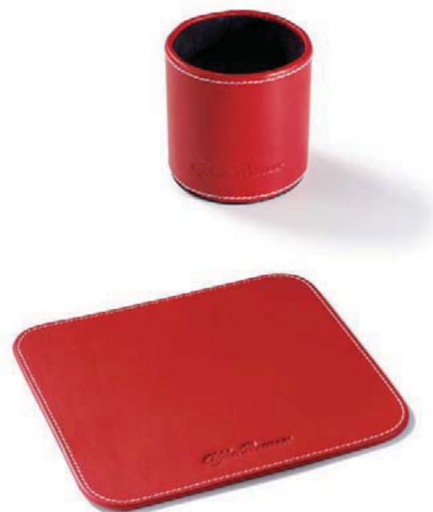
Podkładka pod mysz skórzana. Leather mouse pad.