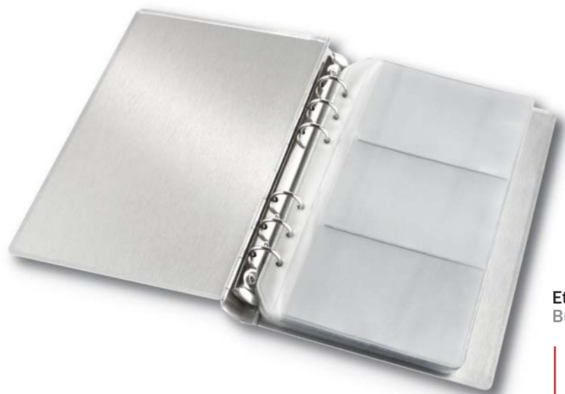
Etui na wizytówki. Business card holder.