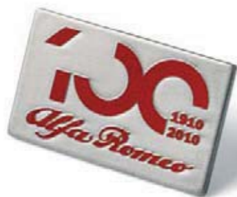
Pin na 100-lecie Alfa Romeo. Centenario Pin.