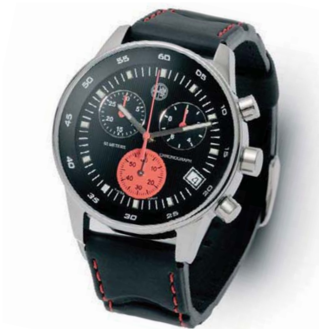
Zegarek Swiss Made. Koperta z nierdzewnej błyszczącej stali. Wodoszczelność do 5 atm. Swiss Made chronograph watch. With polished stainless steel case. Water-resistant to 5 atm.