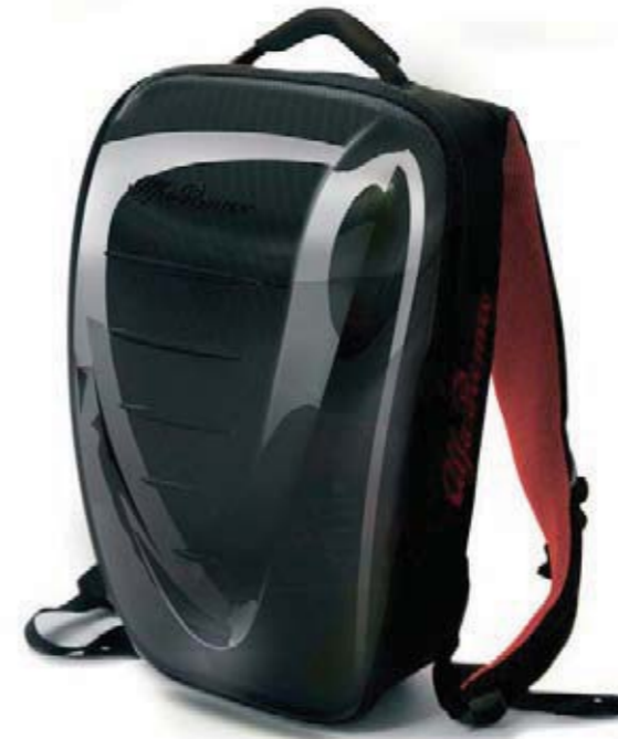
Plecak. Wykonany z polikarbonatu, struktura zawierająca wykończenia z efektem carbon. Wymiary: 34 x 50 x 15 cm. Hard monocoque backpack. Polycarbonate with carbon effect finishes. Dimensions: 34 x 50 x 15 cm.