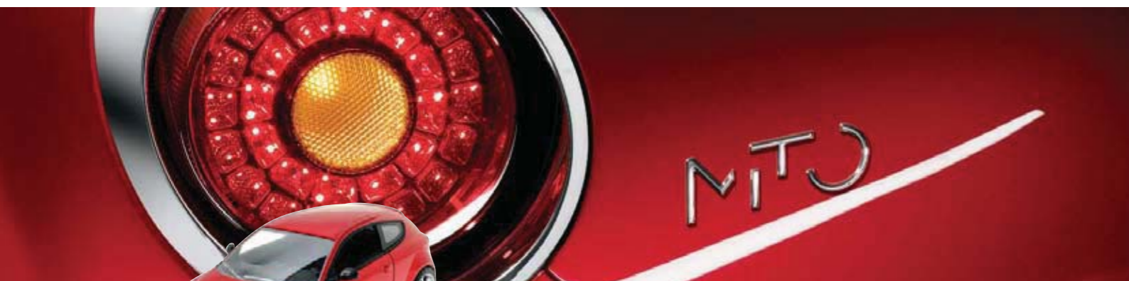
Modelik MiTo. Skala 1:43. 1:43 scale model MiTo.