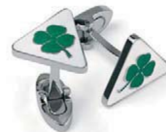
Spinki do koszuli ze znaczkem zielonej koniczynki – Quadrifoglio Verde. Quadrifoglio Verde butterfly cufflinks.