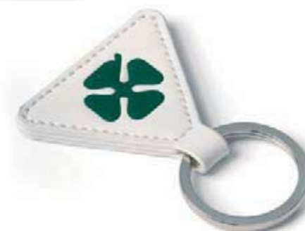
Breloczek na klucze skórzany ze znaczkem Quadrifoglio Verde. Quadrifoglio Verde inlaid leather key ring.