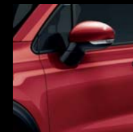
895 CZERWONY PASSIONE