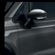
679 SZARY MODA