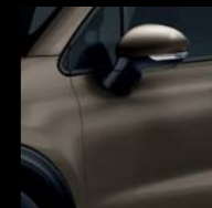
400 BRĄZOWY MAGNETICO