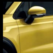
824 ŻÓŁTY AMALFI