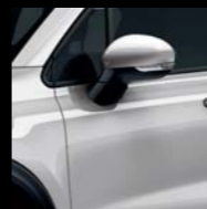
348 SZARY ARGENTO