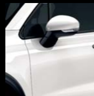
296 BIAŁY GELATO