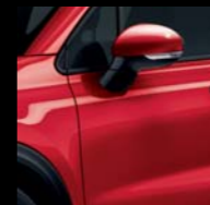
831 CZERWONY AMORE