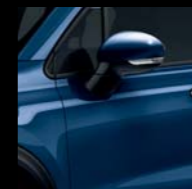
888 GRANATOWY VENEZIA