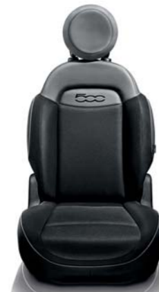
Tkanina czarno-szara Wstawki z wykończeniami w stylu „Carbon look” na tunelu środkowym i panelach drzwi