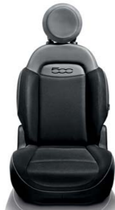
Tkanina czarno-szara Wstawki z wykończeniami w stylu „Carbon look” na tunelu środkowym i panelach drzwi