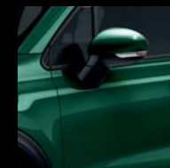
330 ZIELONY TOSCANA