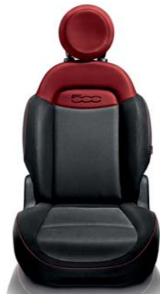
Tkanina szaro-czerwona Wstawki z wykończeniami w stylu „Carbon look” na tunelu środkowym i panelach drzwi