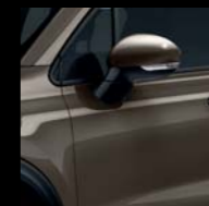
399 BRĄZOWY MAGNETICO