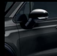
601 CZARNY CINEMA