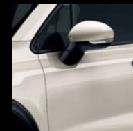
331 SZARY ARTE