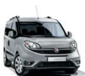
612 Szary Maestro (metalizowany)