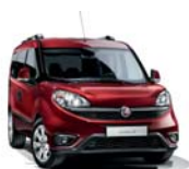
293 Czerwony Amore (metalizowany)