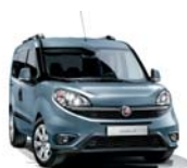
448 Niebieski Canalgrande (metalizowany)