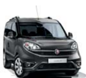
695 Szary Colosseo (metalizowany)