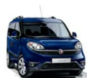
487 Granatowy Mediterraneo (metalizowany)