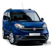
479 Granatowy Riviera (pastelowy)