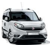
249 Biały Gelato (pastelowy)