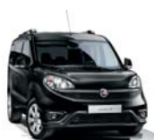
632 Czarny Tenore (metalizowany)