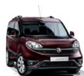
590 Bordowy Montalcino (metalizowany)