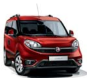
168 Czerwony Passione (pastelowy)