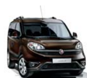
444 Brązowy Magnetico (metalizowany) tylko dla wersji Trekking