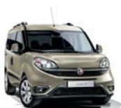
261 Beżowy Spumante (metalizowany)