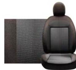
597 Brązowa Pas deski brązowy