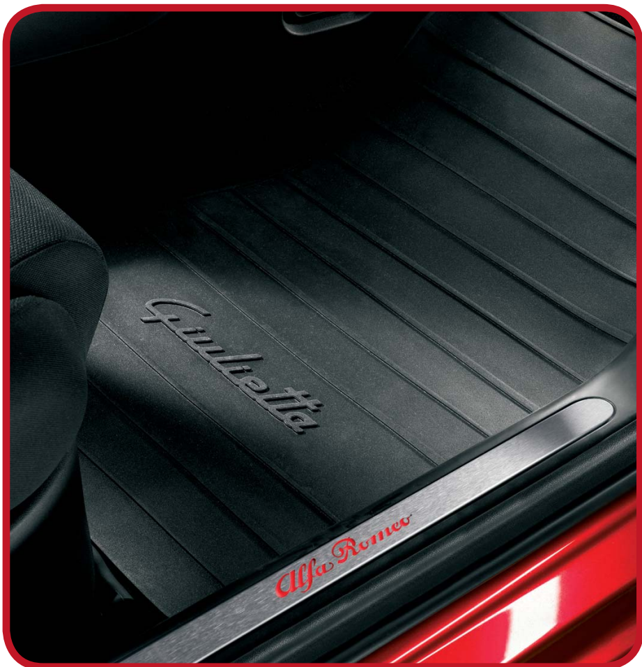
KOMPLET DYWANIKÓW GUMOWYCH GIULIETTA RUBBER MATS KIT