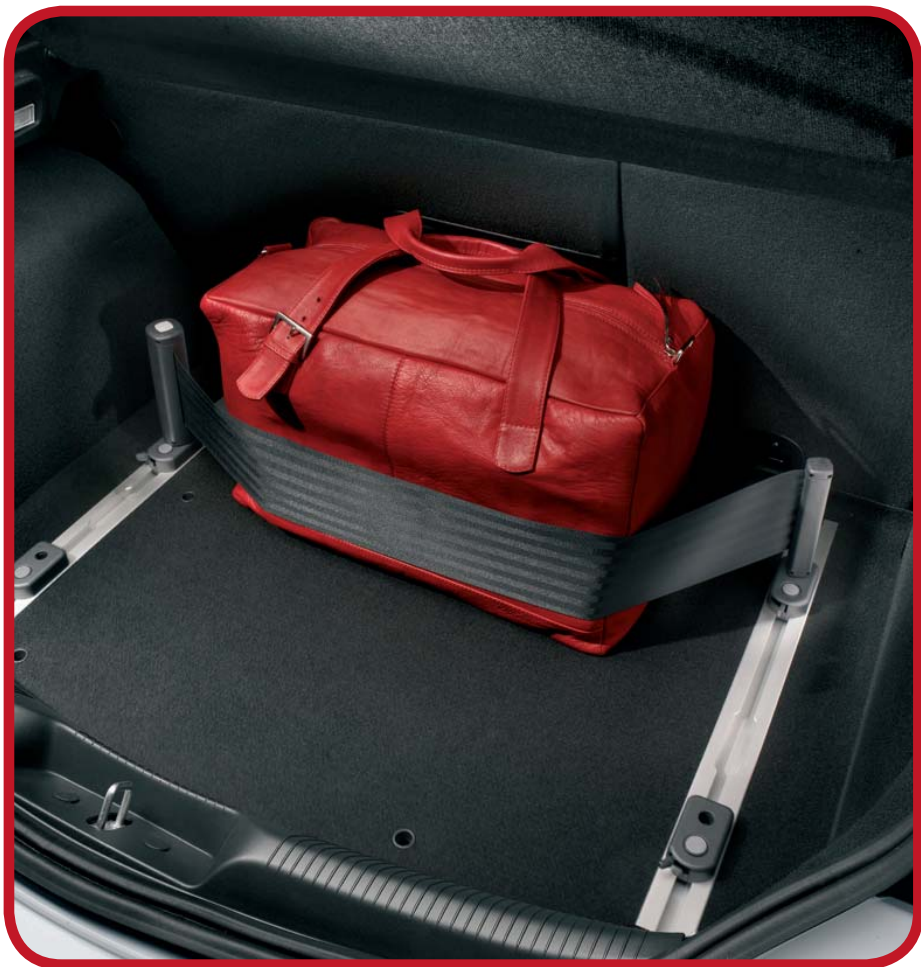
TAŚMA ORGANIZER ORGANISER BAND