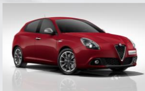
414 CZERWONY - ALFA RED (PASTELOWY)

"5" => STANDARD "-" => OPCJA NIEDOSTĘPNA