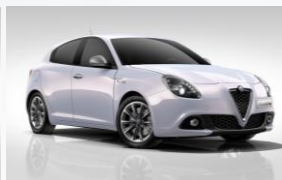
764 BŁĘKITNY - LUNARE WHITE (METALIZOWANY)