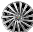
OPCJA 435 OBRĘCZE ZE STOPÓW LEKKICH 18"