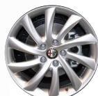
OPCJA 420 OBRĘCZE ZE STOPÓW LEKKICH 17"