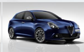
486 NIEBIESKI - ANODIZZATO BLUE (METALIZOWANY)