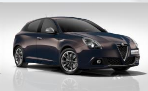
409 SZARY - LIPARI GREY (METALIZOWANY)