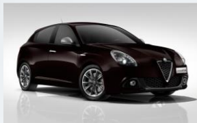
805 CZARNY - ETNA BLACK (METALIZOWANY)