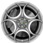
OPCJA 439 OBRĘCZE ZE STOPÓW LEKKICH 18"