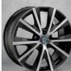
OPCJA 7HP OBRĘCZE ZE STOPÓW LEKKICH 18"