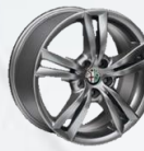
OPCJA 421 OBRĘCZE ZE STOPÓW LEKKICH 17"