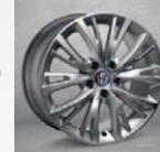
OPCJA 74B OBRĘCZE ZE STOPÓW LEKKICH 17"