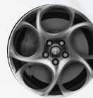
OPCJA 6Y8 OBRĘCZE ZE STOPÓW LEKKICH 17"