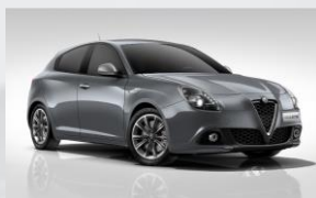
318 SZARY - STROMBOLI GREY (METALIZOWANY)