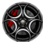
OPCJA 5FB OBRĘCZE ZE STOPÓW LEKKICH 18"