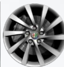
OPCJA 431 OBRĘCZE ZE STOPÓW LEKKICH 16"