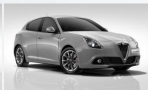
620 SREBNY - SILVERSTONE GREY (METALIZOWANY)