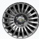
OPCJA 404 OBRĘCZE STALOWE Z KOŁPAKAMI 16"