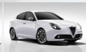
217 BIAŁY - ALFA WHITE (PASTELOWY)