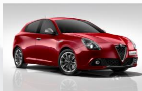
361 CZERWONY - COMPETIZIONE RED (TRÓJWARSTWOWY)