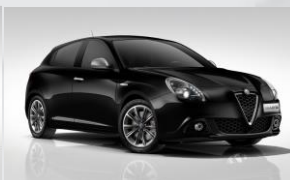
601 CZARNY - ALFA BLACK (PASTELOWY)