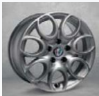
OPCJA 74A OBRĘCZE ZE STOPÓW LEKKICH 16"