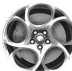
OPCJA 5YN OBRĘCZE ZE STOPÓW LEKKICH 17"