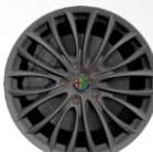
OPCJA 73Z OBRĘCZE ZE STOPÓW LEKKICH 18"