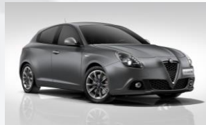
529 SZARY - MAGNESIO OPACO GREY (MATOWY)